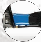
3,1 kW-starker Elektromotor mit vollintegrierter Elektronik