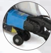
2,8 kW-starker Elektromotor mit vollintegrierter Elektronik