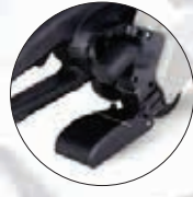
Eingebauter Staubsaugeranschluss für staubfreies bzw. sauberes Arbeiten