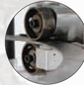
Ausgezeichnete Kraftübertragung und Vermeidung eines Schlupfeffekts dank patentiertem Antriebsrollen-System